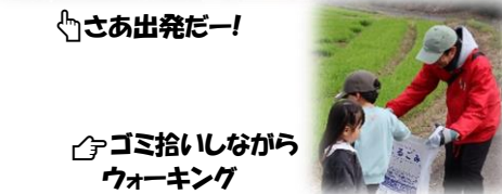
🏠 ゴミ拾いながらウォーキング