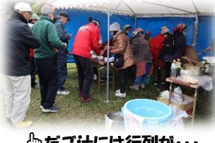
👉 だご汁には行列が...